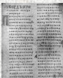
Двинская уставная грамота

Лихоимец – жадный вымогатель, взяточник».