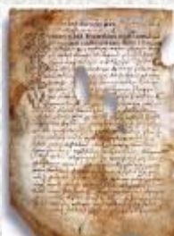
Псковская судная грамота

Двинская уставная грамота 1397 года. Мздоимство упоминается в русских летописях XIV века, например в Двинской уставной грамоте 1397 года в статье 6: «А самосуда четыре рубли, а самосуд то: кто изыснав татя с поличным, да отпустит, а себе посул возьмет, а наместники доведаются по заповеди, ино то самосуд, а опричь того самосуда нет». Там же, в статье 8: «...а черес поруку не ковати, а посула в железех не просити; а что в железех посул, то не в посул».